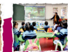
AC SMART CLASSROOMS