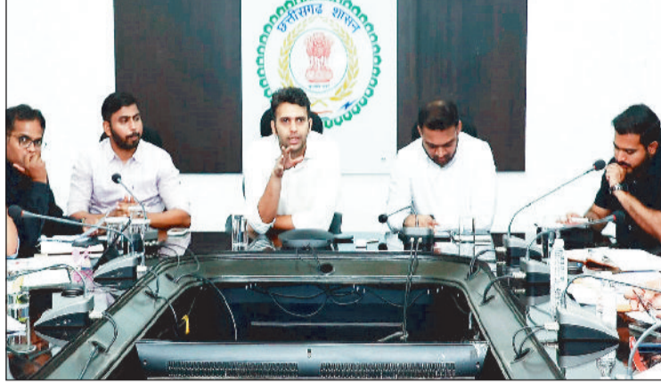
अधिकारियों की बैठक लेते कलेक्टर।

कलेक्टर ने अधोसंरचना विकास से जुड़े आवेदनों, विशेषकर सड़क निर्माण एवं अन्य मूलभूत सुविधाओं के प्रस्तावों पर गंभीरता से कार्य करने के निर्देश दिए। उन्होंने कहा कि प्रस्ताव तैयार करते समय क्षेत्र की वास्तविक आवश्यकताओं को प्राथमिकता दी जाए तथा व्यावहारिक एवं प्रभावी समाधान प्रस्तुत किए जाएं। कलेक्टर ने कहा कि आम नागरिकों की समस्याओं के त्वरित समाधान के लिए 19 मार्च को पुसौर तथा 20 मार्च को विकासखंड धरमजयगढ़ अंतर्गत छाल में तहसील स्तर पर